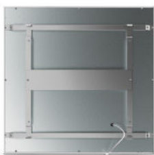
Rückansicht 800 W