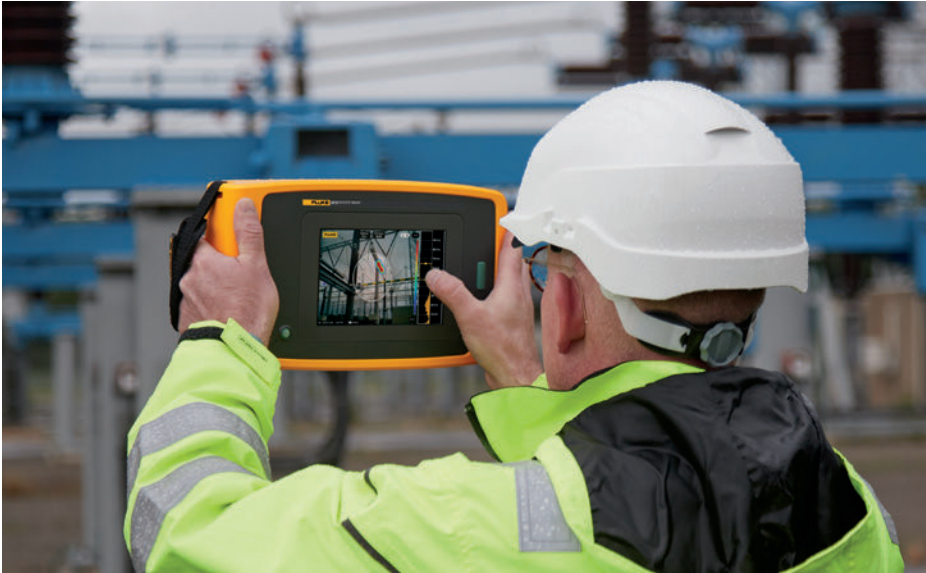
Präzisions-Schallkamera ii910 bei der Erkennung von Teilentladungen in einer Hochspannungsanwendung.