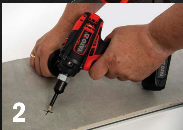
Festhalten und Anbohren