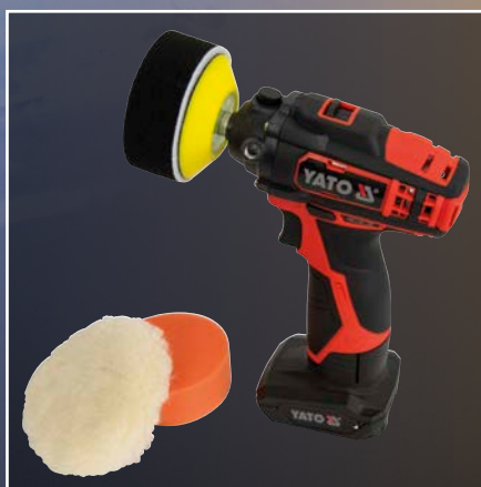
Akku Schnellläufer mit verschiedenen Polierpads