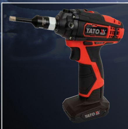
Akku Schnellläufer mit DIAMANT Fliesenbohrer „BRIdiamondDrill“ Größe Ø 8 mm