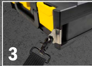
Karabiner des Tragegurtes an den Clipsen befestigen