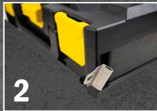
Clipse an beide Seiten der Boxen anbringen