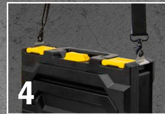
Box ist bereit zum Tragen mit dem Tragegurt