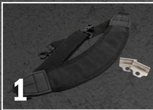
Tragegurt und Clipse extra